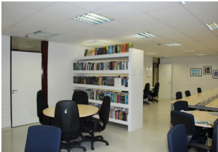
Sala de Estudo e Pesquisa Ariano Suassuna