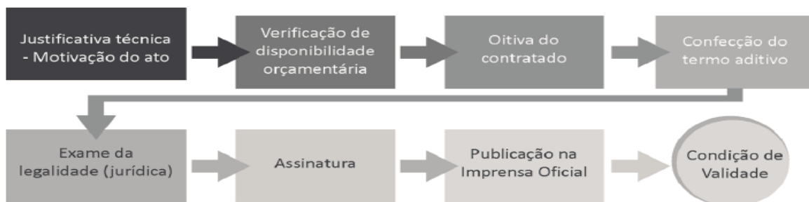
Figura 5 – Fluxo da alteração contratual.

Esquematicamente os aditivos contratuais devem obedecer ao fluxo abaixo: