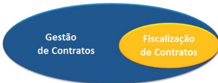
Figura 3 – Abrangência da gestão e fiscalização de contratos.

Assim, de um modo esquemático, as funções de gestão e fiscalização de contratos têm abrangências distintas 4 :