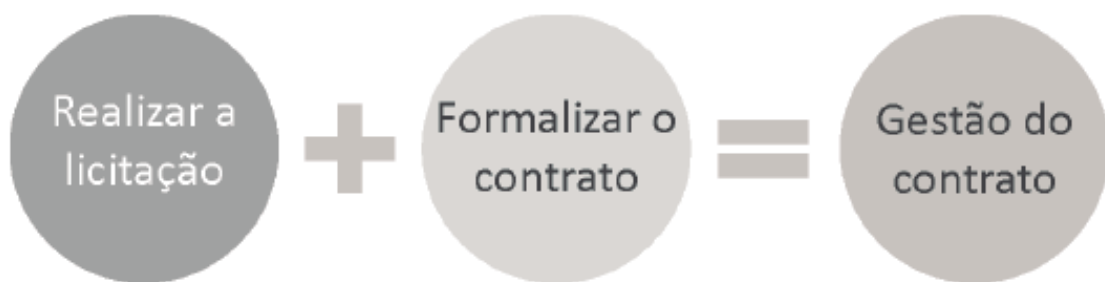
Figura 2 – Ciclo contratual.

Gestor/fiscal/executor de contrato: é o servidor previamente designado pelo titular do órgão de lotação, por meio de Ordem de Serviço publicada no Diário Oficial do Distrito Federal, para acompanhar e fiscalizar a execução do contrato, o que ocorre (deve ocorrer) conforme o ciclo abaixo: